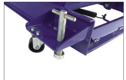
Lenkrollen und Bodenarretierung für hohe Standfestigkeit