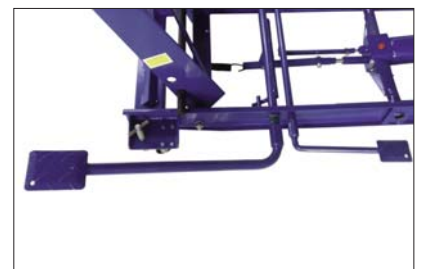
Hub- und Senkpedal