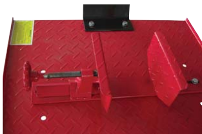
Radhalter mit Überrollschutz