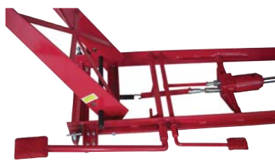
Hub- und Senkpedal