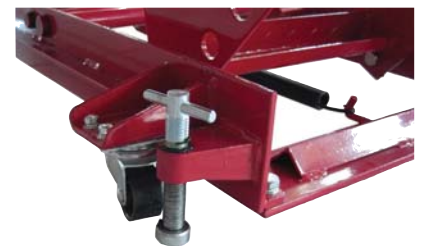
Lenkrollen und Bodenarretierung für hohe Standfestigkeit